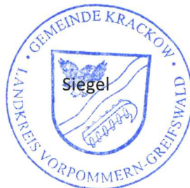
Gerd Sauder Bürgermeister