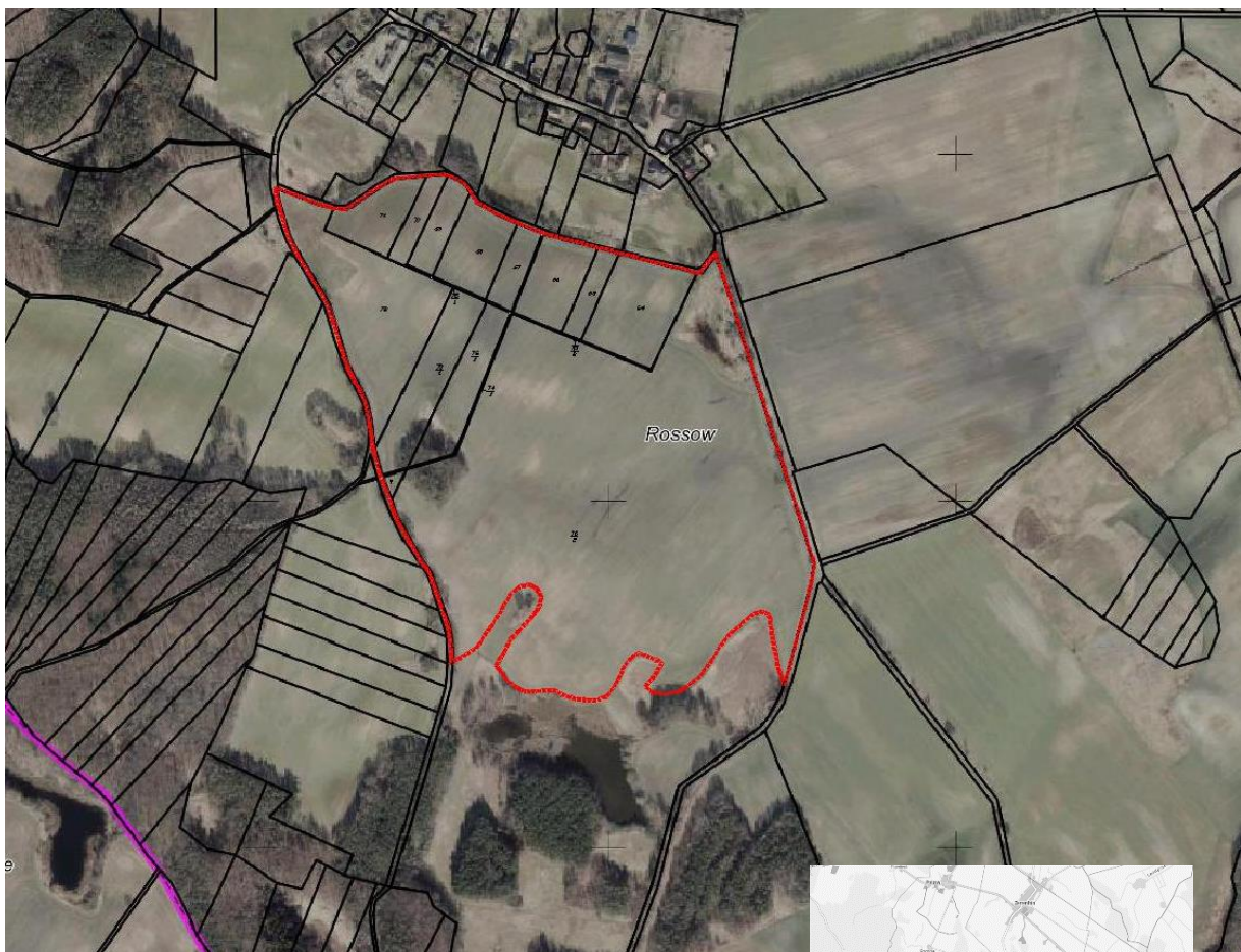
GeoBasis -DE/M-V 2022

Der Standort liegt bei einer Höhe von ca. 40 m bis 60 m ü. NHN und ist nahezu eben.