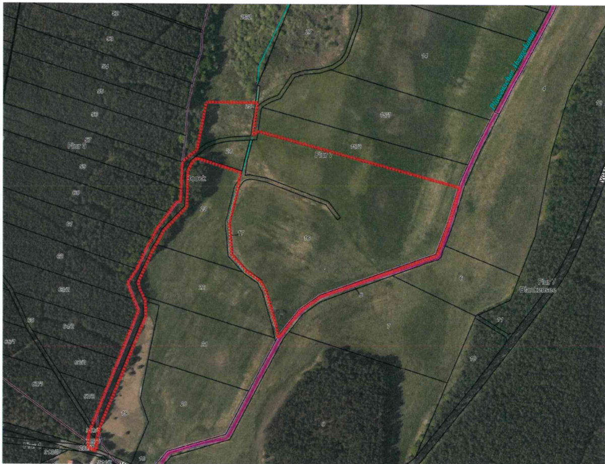
Übersichtsplan, Quelle: GeoPortal M-V 2022

Der Geltungsbereich des Bebauungsplans befindet sich östlich der Ortslage Boock und umfasst auf einer Fläche von 7,11 Hektar die Flurstücke 289/5 (teilweise) und 320/3 (teilweise) der Flur 1 sowie die Flurstücke 9 (teilweise), 16, 17 (teilweise), 24 und 26/2 (teilweise) der Flur 7; alle in der Gemarkung Boock. Er ist in nachfolgender Abbildung dargestellt.