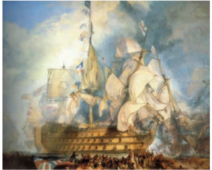
Das Linienschiff „Victory“ in der Seeschlacht bei Trafalgar. Sie war das Flaggschiff von Admiral Nelson. Dargestellt ist der Moment, als das berühmte Flaggensignal gesetzt wurde, das jeden Briten zur Pflichterfüllung in der Schlacht aufforderte. Nach dem Tode von Nelson wurde die HMS „Victory“ das Flaggschiff der inter dem Kommando von Vizeadmiral James Saimarez (1757–1836) stehenden britischen Ostseeflotte.

Da die Dänen nicht einlenkten ordnete Admiral Gambier am 02.09.1807 ein Bombardement von Kopenhagen an. Im Zeitungsstil, der sehr viel über die Denkungsart der damaligen gebildeten Leute aussagt, fand dieses Ereignis auch seinen Nachklang in einem Nachschlagewerk von 1809: „Es bedarf übrigens wohl nur einer kurzen Erwähnung, wie sehr in der neuesten und gewiß allermerkwürdigsten Zeitgeschichte auch Dänemark, das so lange eine ungestörte Neutralität genossen hatte, von England auf die auffallendste Weise gezwungen wurde, jener zu entsagen, und unter dem grundlosen Vorwande, dass Dänemark