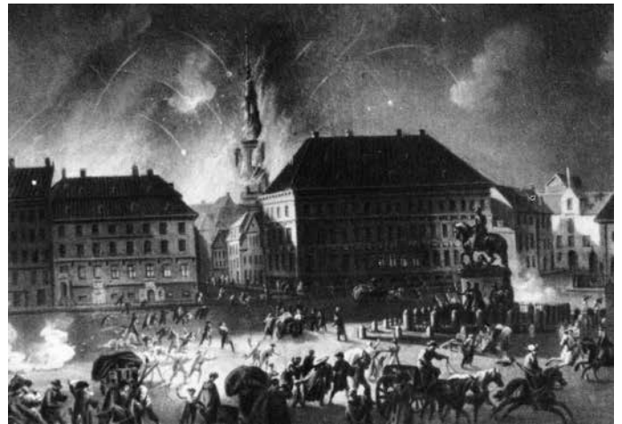
Vom 2. bis 4. September 1807 lässt der britische Admiral James Gambier (1756–1833) Kopenhagen systematisch durch Schiffsgeschütze bombardieren um so die Herausgabe der dänischen Flotte zu erzwingen. Er kommandiert bei diesem Unternehmen gegen Dänemark 16 Linienschiffe, 40 Fregatten und andere Fahrzeuge und 380 Transporter mit 29.000 Mann Landungstruppen. Die Dänen lieferten ihre Flotte aus.

Das britische Ostseegeschwader aus 12 Linienschiffen unter Vizeadmiral Saumarez verstärkte die schwedische Flotte. Die Linienschiffe „Implacable“ und „Centaur“ (die erbeutete dänische „Norge“) unter Konteradmiral Samuel Hood verfolgten die Nachhit der russischen Flotte und kämpften das russische Linienschiff „Wsewolod“ nieder. Das Schiff lief auf Grund und wird verbrannt. Die britisch-schwedische Übermacht zur See ist 1808 erdrückend, so dass es zu keinem weiteren Schlagabtausch der Hochseefloten kam.