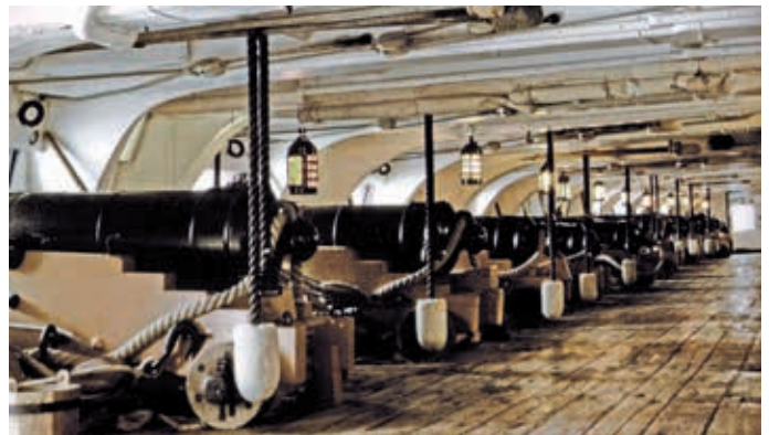
Batteriedeck der HMS „Victory“. Das Schiff wurde 1760 bei der britischen Marine in Dienst gestellt. Und gehört noch heute zum Bestand der Flottenliste. Liegeplatz ist Portsmouth.

ohnehin auf Frankreichs Zunöthigungen, mit dieser Macht gemeinschaftliche Sache zu machen, und besonders auch derselben seine Seemacht gegen England zu überlassen im Begriff gewesen sei, mit Gewalt angegriffen und auf das fürchterlichste entwaflnet wurde. Kurz, England, welches in der Neutralität Dänemarks eine Gefahr für sich fand, und ihr vorzubauen suchte, sendete im August 1807 eine Flotte unter dem Admiral Gambier und Catheart in den Sund, um damit das Verlangen zu unterstützen, die dänischen Linienschiffe einstweilen in einen der Häfen Sr. britischen Majestät einzuliefern; und da Dänemark, gestützt auf seine gerechte Sache, dies schlechterdings nicht wollte, noch konnte, so erschien die englische Flotte vor Coppenhagen, und richtete durch das wirklich unmenschliche Bombardement vom 2. bis 5. Sept. eine solche schreckliche Verwüstung in Coppenhagen an, dass Dänemark sich genötigt sah, am 7. Sept. durch Capitulation seine ausgerüstete und in segelfertigen Stand gesetzte Flotte den Eng-