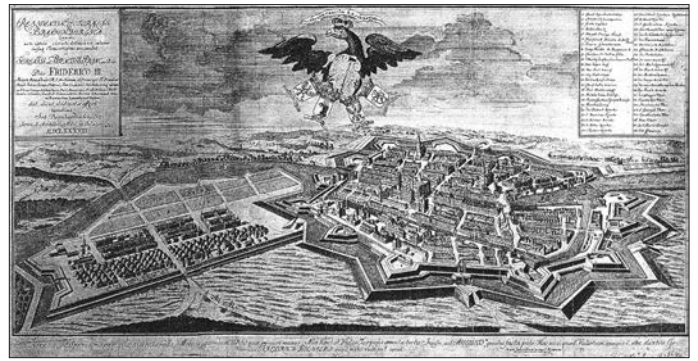
Lageplan der Festungsstadt Berlin zur Zeit des Todes des „Großen Kurfürsten“ (1688). Unter der Regentschaft seines Sohnes, Kurfürst Friedrich III., kam das Ingenieurwesen in Brandenburg zu einer gewissen Blüte. Maßgeblich war der Einfluss der eingewanderten Hugenotten.