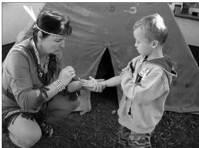
Vorbereitung auf den Indianertanz.

verteidigen, dazu galt es viele anspruchsvolle Stationen zu bewältigen. Unter anderem fand ein Pferderennen statt, denn ein richtiger Indianer kann mit seinem Pferd über jedes Hindernis reiten. Außerdem können Indianer auch gut hören, fühlen und treffen, dies konnten sie beim Zapfenweitwurf, Geräuschememory und bei der Fühlstrecke, mit unterschiedlichen Naturmaterialien, unter Beweis stellen.