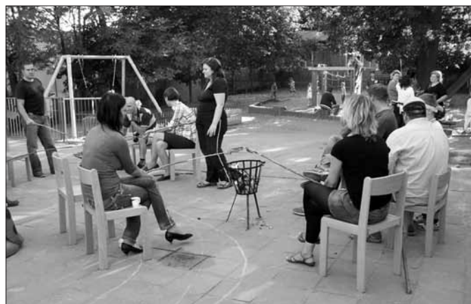
Entspannen am Lagerfeuer.

Mit Stockbrot und Bratwurst konnten es sich alle am Lagerfeuer gut gehen lassen, was einen Erfahrungsaustausch ermöglichte.