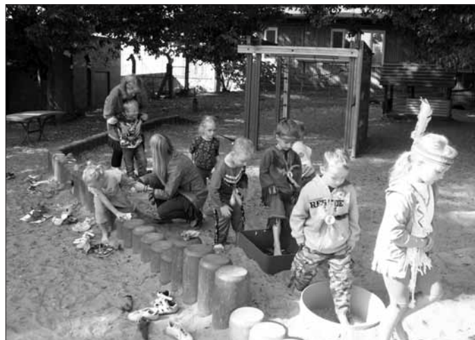
Fühlen mit den Füßen.

verteidigen, dazu galt es viele anspruchsvolle Stationen zu bewältigen. Unter anderem fand ein Pferderennen statt, denn ein richtiger Indianer kann mit seinem Pferd über jedes Hindernis reiten. Außerdem können Indianer auch gut hören, fühlen und treffen, dies konnten sie beim Zapfenweitwurf, Geräuschememory und bei der Fühlstrecke, mit unterschiedlichen Naturmaterialien, unter Beweis stellen.