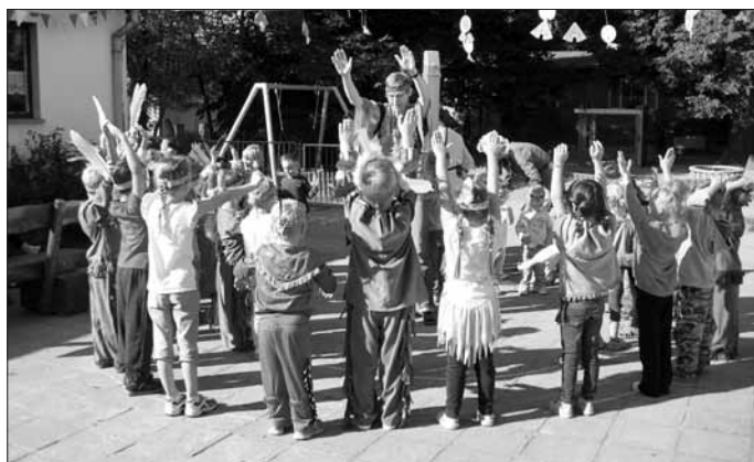
Begrüßung der neuen Indianer.

Im Anschluss mussten die Käfer-, Schmetterlings-, Igel- und Frosch-Indianer ihre Stammesnamen vom letzten Jahr