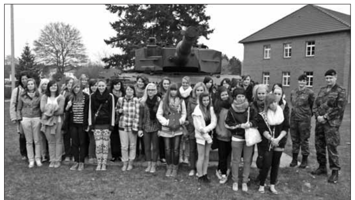
Die Schülerinnen vom Girls Day 2013 beim Besuch in der Bundeswehrkaserne „Ferdinand-von-Schill“ am Standort Torgelow vor dem Kampfpanzer Leopard 2.

Neben der Vorstellung von den Tätigkeiten eines Stabsdienstsoldaten, eines Instandsetzungssoldaten und eines Materialbewirtschaftungssoldaten bildete den Höhepunkt des Tages die Station Panzerschau, bei der der Kampfpanzer Leopard 2 A5 vorgestellt wurde. Jeder, der Lust dazu