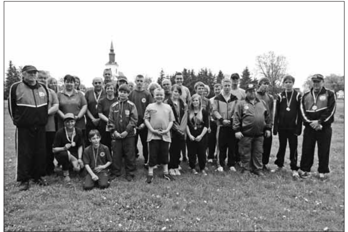
Nach der Siegerehrung stellten sich alle Teilnehmer zum Gruppenfoto auf.