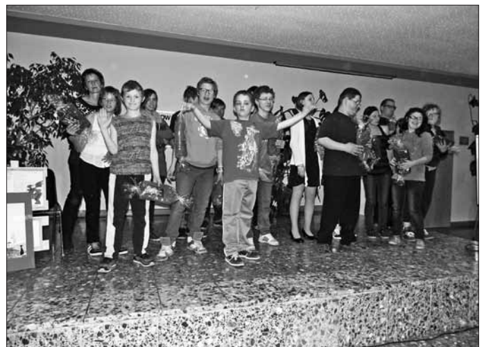
Alle Künstler versammelten sich zum Abschluss auf der Bühne. Sie erhielten noch ein Danke-Schön-Geschenk.