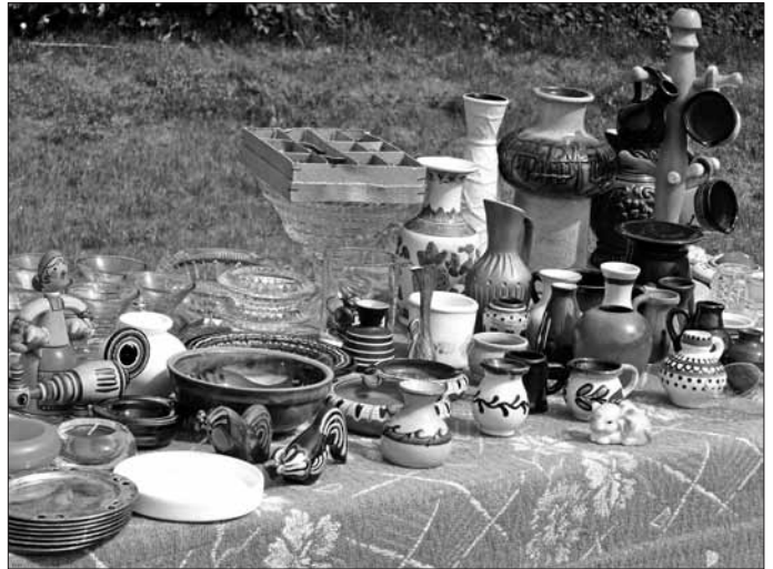
Wie auf einem orientalischen Markt wurde auch in Pampow viel Keramik angeboten.