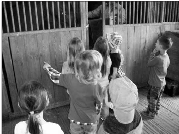
Die Pferde sind aber groß!

Die Schmetterlinge der AWO-Kita „Pusteblyume“ arbeiteten an dem Projekt „Tiere in unserer Umgebung“. Viele Tiere wurden zum Gesprächsthema. Die Kinder hatten die Gelegenheit, Erfahrungen und Geschichten über ihre eigenen Haustiere zu erzählen.