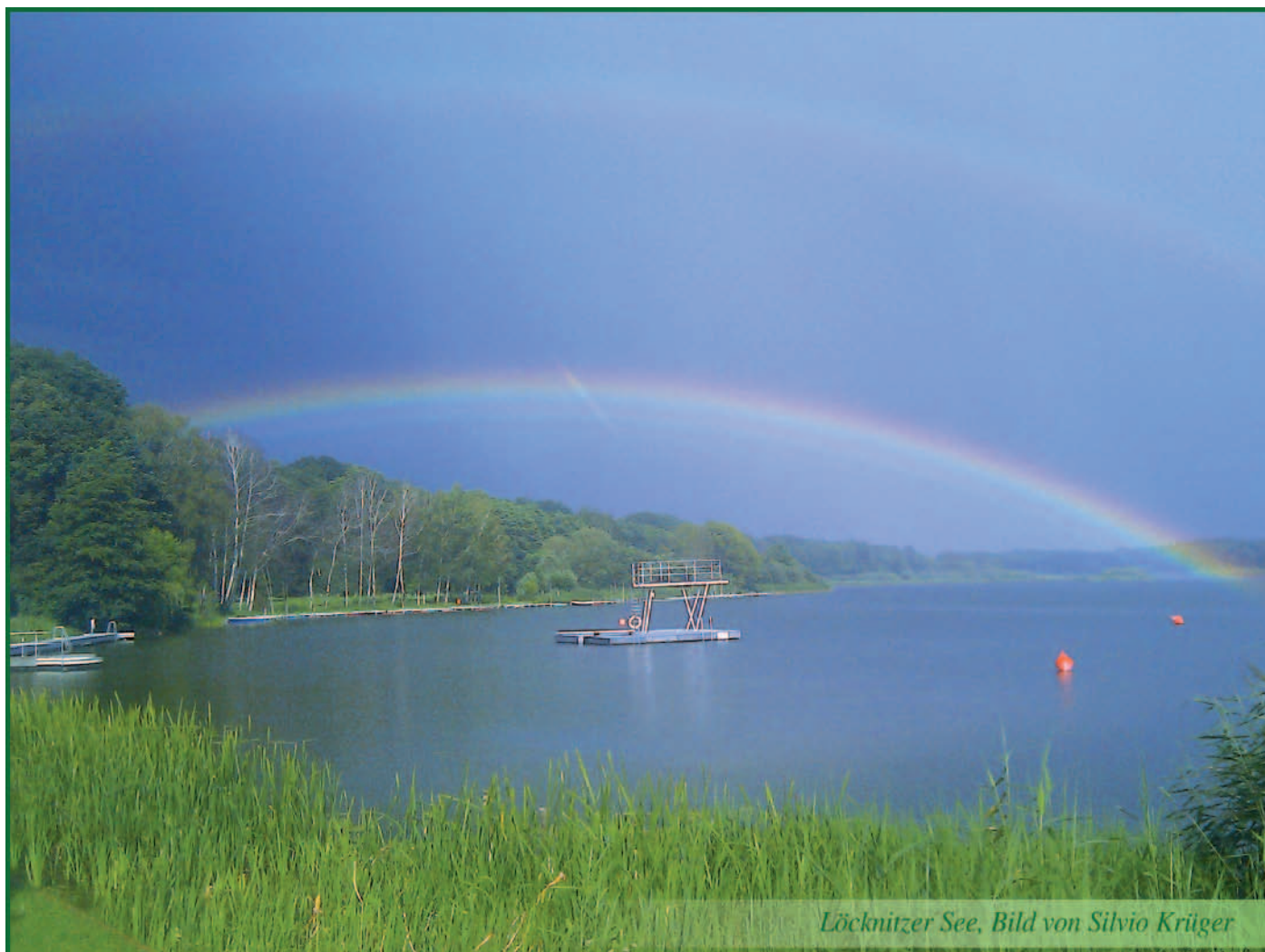
Löcknitzer See