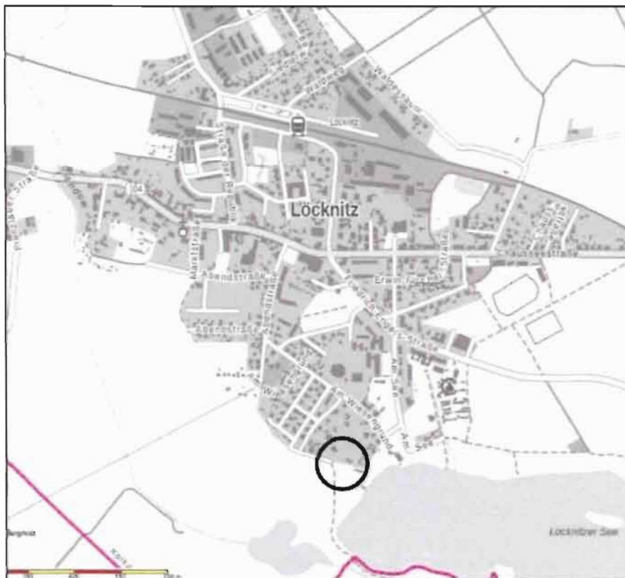
Übersichtsplan

Das 0,219 ha große Gebiet umfasst teilweise die Flurstücke 328/3, 486, 487/3 sowie die Flurstücke 329/4, 487/2, 488/4 alle in der Flur 1 der Gemarkung Löcknitz. Das Plangebiet befindet sich gemäß Kennzeichnung im beiliegenden Übersichtsplan südlich der Wohnbebauung „Am Wiesengrund 3 und 4“. Der Planbereich ist von Wohnbau- und Grünlandflächen umgeben.