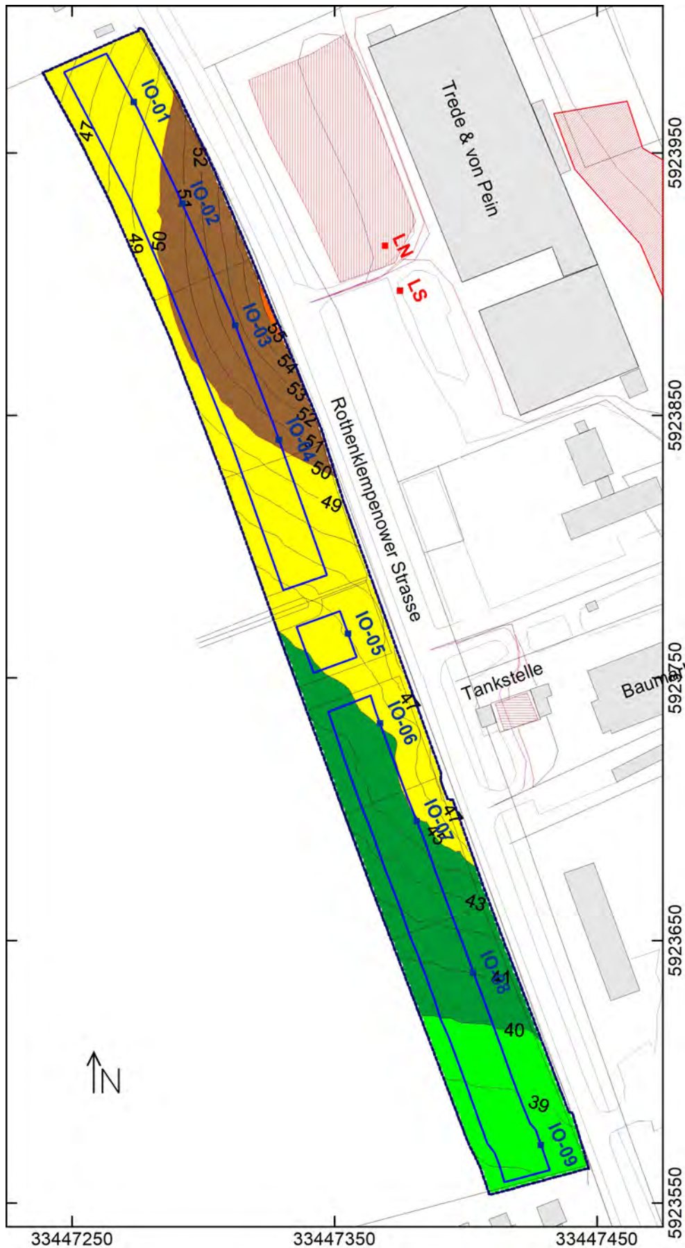
Abbildung 2: Beurteilungspegel Nacht