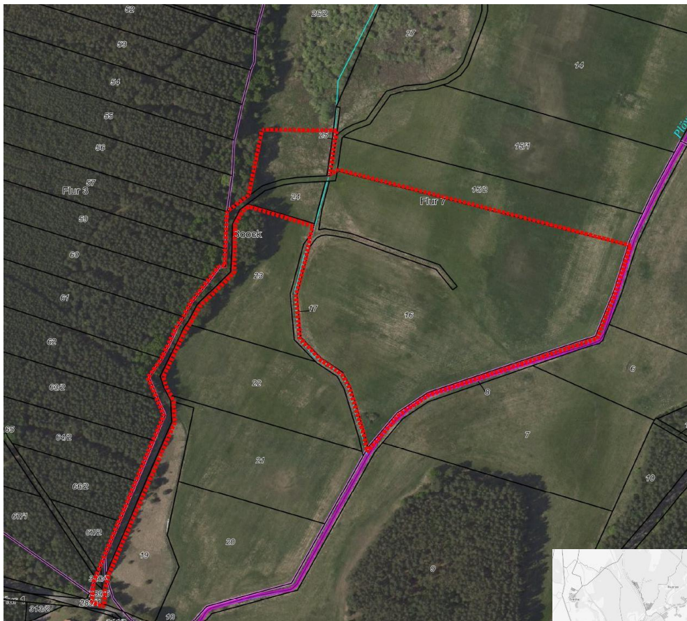
GeoBasis -DE/M-V 2020

Der Standort liegt bei einer Höhe von ca. 12,5 m ü. NHN und ist nahezu eben.